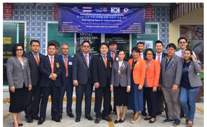
การทำ Global Grants ของสโมสรโรตารีภูเก็ตเข้าที่

การบริจาค การทำโครงการ ไม่ว่าจะ District Grant หรือ Global Grant ล้วนแล้วสามารถสร้างประโยชน์ให้กับโลกเราได้ ขอทุกท่านศึกษา ทั้งสองรายการ ไม่ยากครับ ผมพร้อมให้คำตอบ และคำปรึกษาในการดำเนินการอย่างเต็มที่